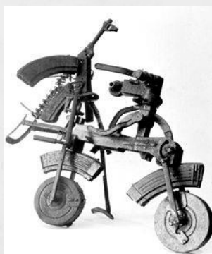
Motociclista, de F. Rosa.