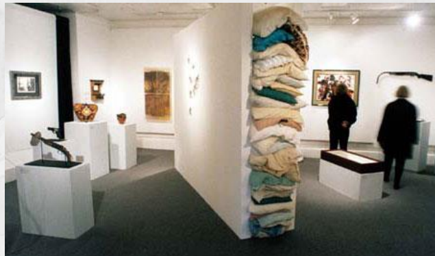
Fotografía de la exposición en Portland.

- Guns in the hands of artists, a meditation on the gun in the early 21st Century 5 . Este proyecto fue impulsado por el artista americano Brian Borrello en Nueva Orleans, 1996 y en el año 2001 en Portland, Oregon, en el que participaron medio centenar de artistas locales para transformar 50 armas incautadas por la policía en trabajos artísticos. Según el artista, el proyecto pretendía ser un foro para la comunidad para considerar, analizar y reconocer la presencia de las armas en la cultura americana.