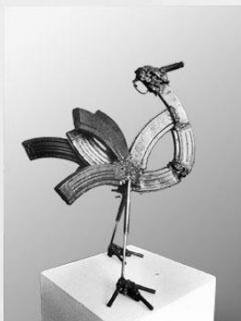
Passeante, de Hilario.

las armas destruidas en esculturas, en la que participaron 14 escultores de la asociación de artistas Núcleo de Arte .