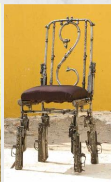
Silla realizada por Petsampeseth

- Sculptures pour la paix 9 , Haití. La escultora Barbara Prezéau ideó este proyecto con el objetivo de “dar a conocer la realidad del DDR en el país y reflexionar sobre el papel de los artistas haitianos” . Contó con la colaboración de 30 escultores que durante 15 días transformaron armas decomisadas como parte del programa de DDR que el PNUD llevó a cabo en el país.