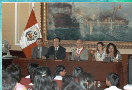
Fotografías de Marruecos y Perú.

Hasta ahora podemos resumir los resultados parciales de Un Mundo Teñido de Paz en los siguientes puntos: