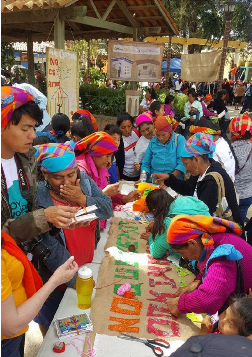
Acto simbólico en La Esperanza, Honduras.

Associació Teixint fils emocions ARTiPAU